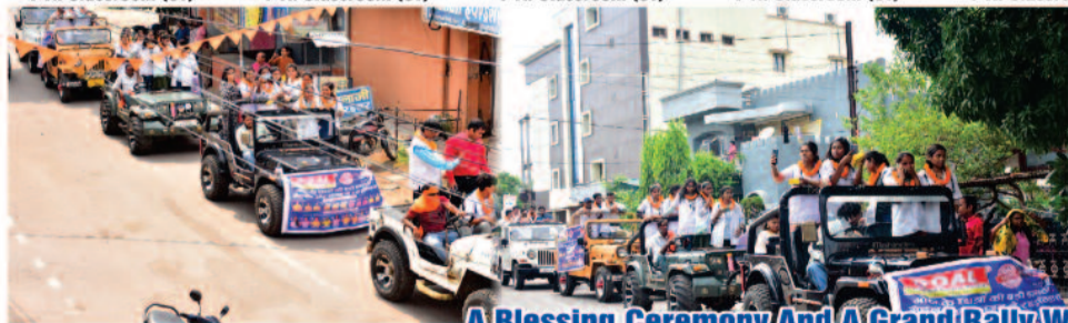
A Blessing Ceremony And A Grand Rally Was Organized By GOAL Institute Bhilai Center On-09.06.2024.